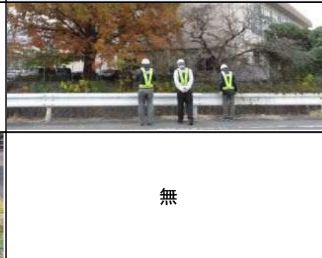
危険個所詳細 特になし