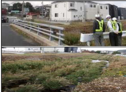
危険個所詳細 草木多い