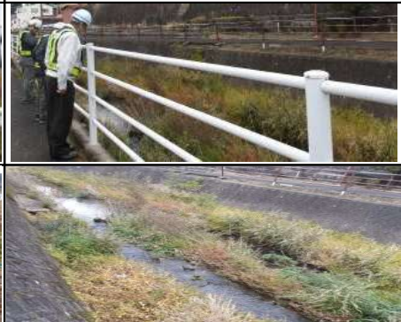
危険個所詳細 草木多い