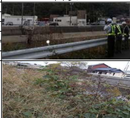
①宇美二丁目 小林酒造横 危険個所詳細 草木多い