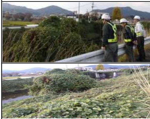
危険個所詳細 草木多い