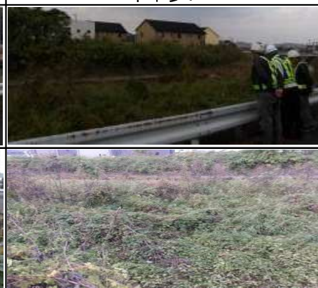
②下宇美 おかべ小児科横 危険個所詳細 草木多い